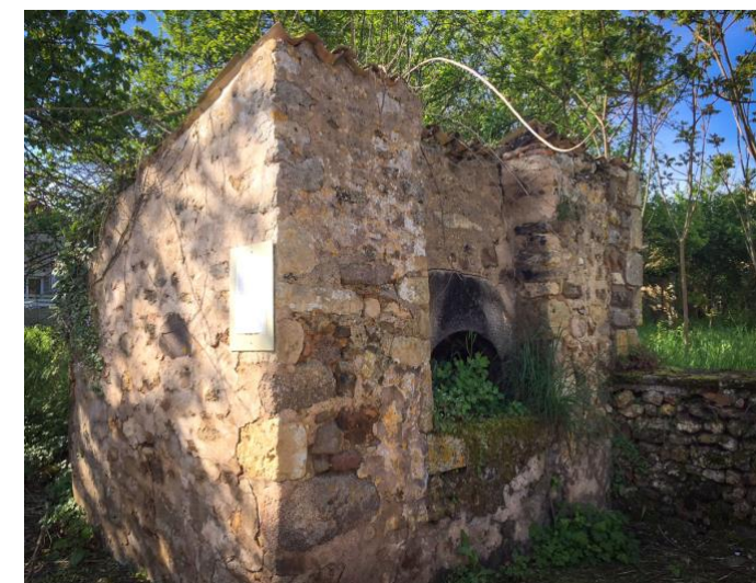
Photo en haut à droite : le four à pain le jour de son acquisition. Photo du bas : après plusieurs semaines d'intervention des artisans l'Atelier de l'œuvre et Sylvain Legris, le four à pain trouve une deuxième jeunesse.

NB : la restauration du four à pain a coûté 9 400 € et a bénéficié d'une subvention du Conseil Départemental des Deux Sèvres d'un montant de 5 860 € ce qui induit un investissement communal de 3 540 €.