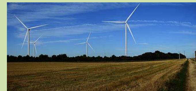
Photo ci-dessous : le parc éolien de Pamproux ne s'étendra pas sur Saint-Germier

Il est fort probable que le préfet des Deux Sèvres, seule autorité compétente pour autoriser ce projet, suive l'avis défavorable de ce commissaire enquêteur. La mobilisation de vous tous aura donc payé.